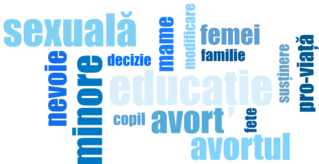
Figura 1. Cele mai frecvente asocieri de termeni în postările în care se discută dreptul la avort

același context discursiv. Cu toate că ne așteptam la menționări privind metodele contraceptive, acest termen nu se regăsește în documentele analizate. „Planning-ul familial” apare o singură dată, într-un discurs electoral din 2024 al lui Nicolae Ciucă, în contextul necesității creșterii demografice, nu în cel al facilitării accesului la servicii de sănătate reproductivă.